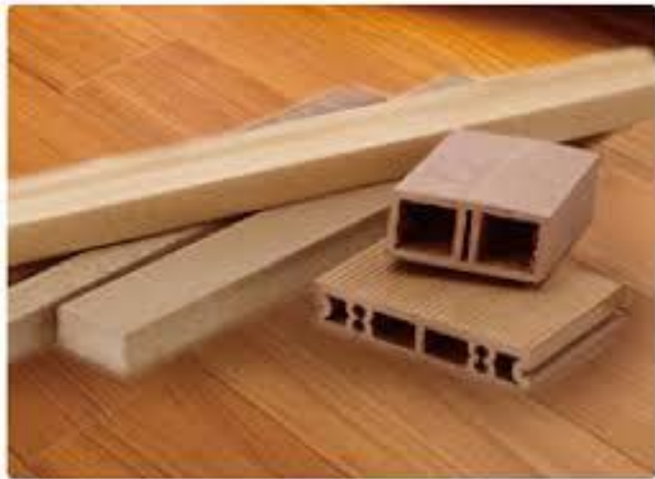
100% 聚酯纖維再生原料 ➡ 塑木