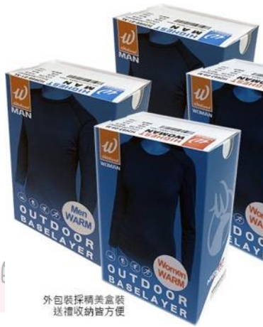
外包装採購美盒裝 送禮收納皆方便