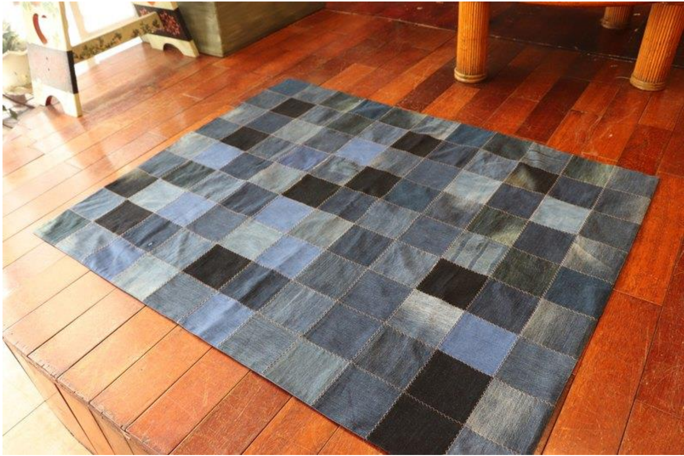
二手牛仔褲 → 丹寧地墊