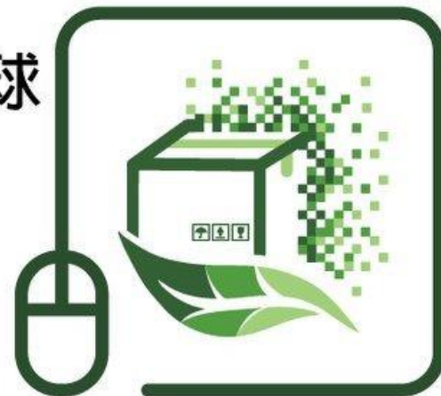
網購包裝減量標章